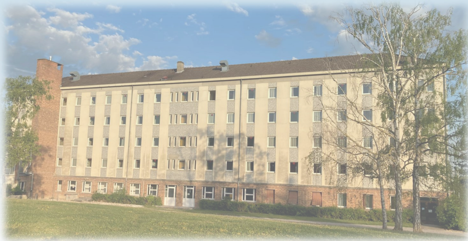
Le bâtiment d'internat, l'équipe et les chambres