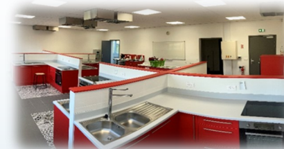
Les cuisines pédagogiques