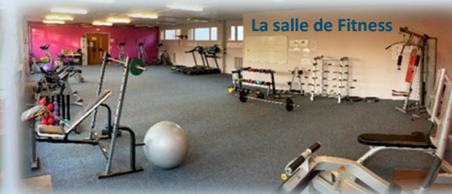
La salle de Fitness